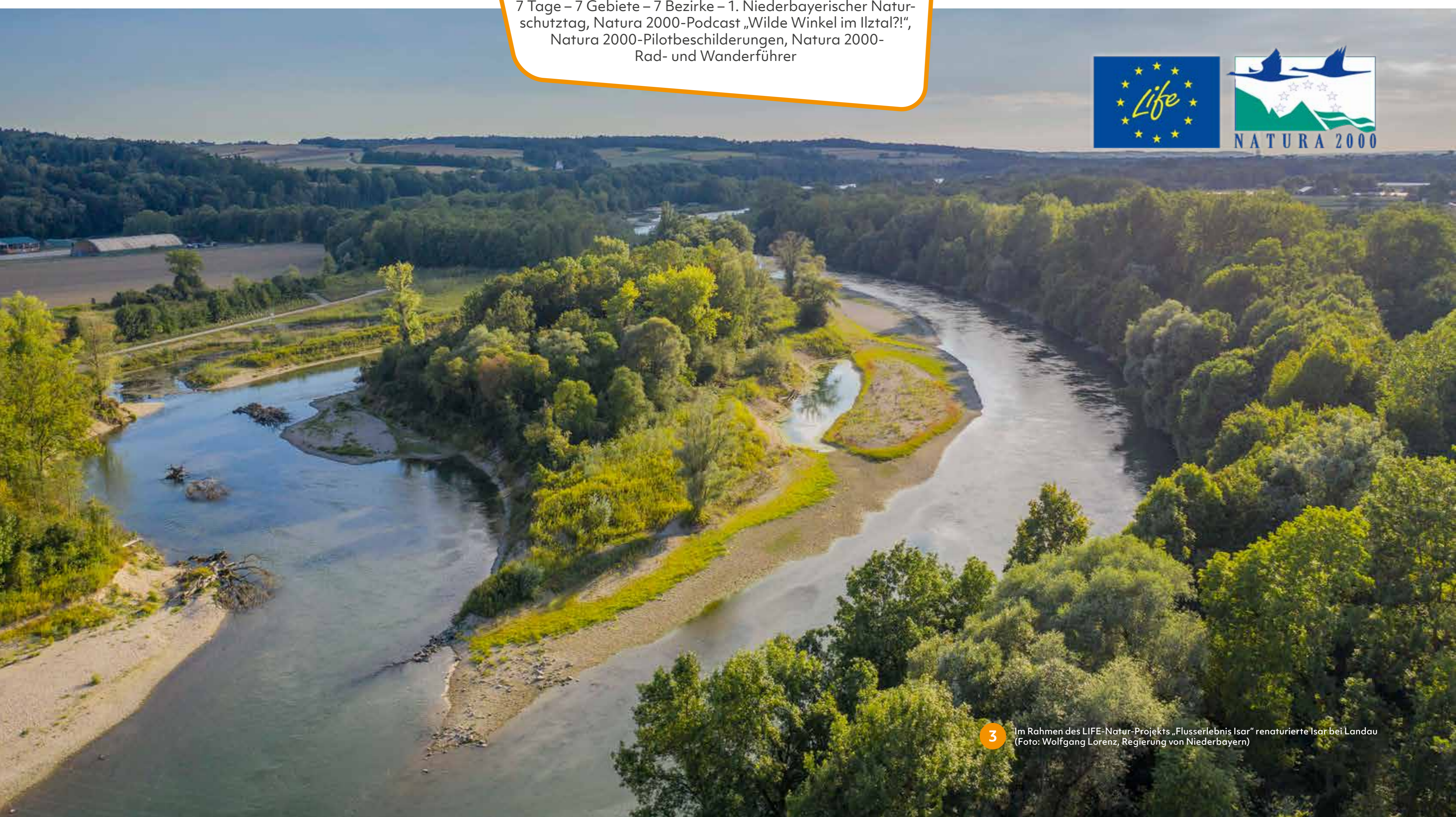
3 Im Rahmen des LIFE-Natur-Projekts „Flusserlebnis Isar“ renaturierte Isar bei Landau