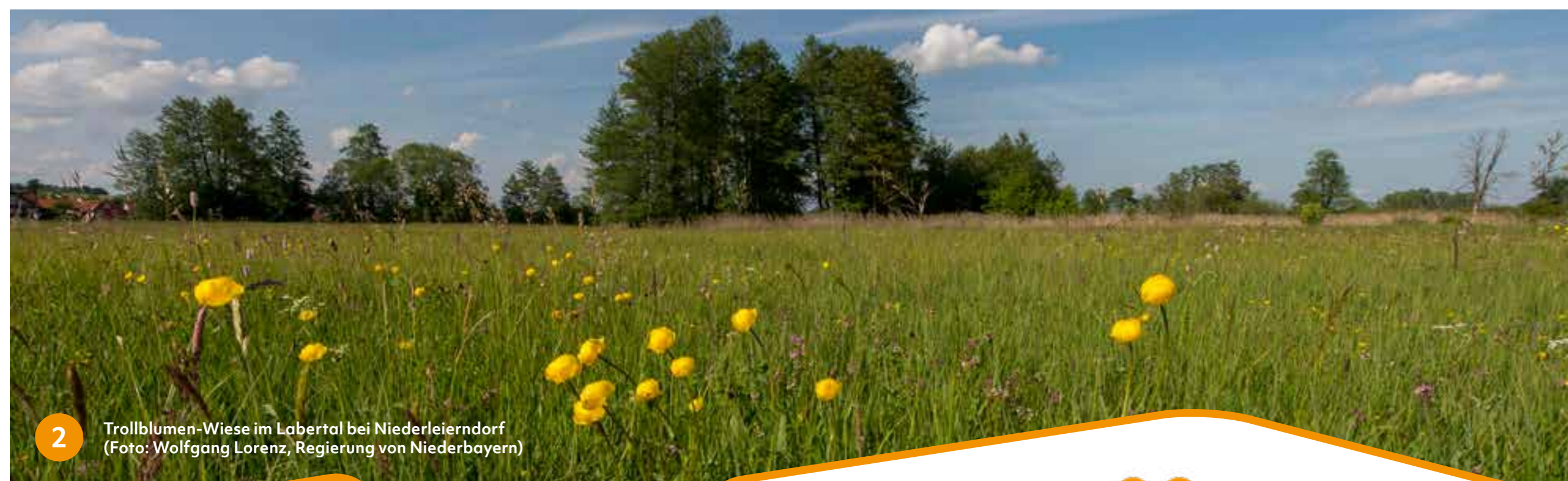
2 Trollblumen-Wiese im Labertal bei Niederleierndorf