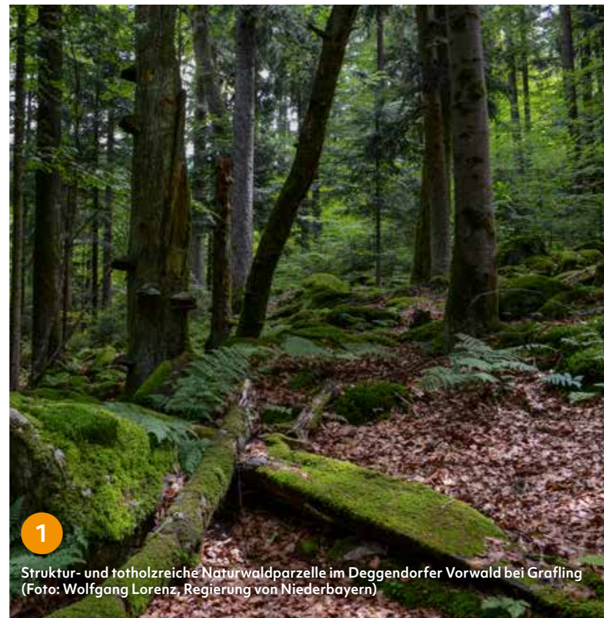
1 Struktur- und totholzreiche Naturwaldparzelle im Deggendorfer Vorwald bei Grafing