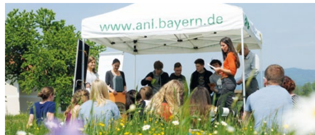
Bei der Schüleraktion 2018 stand das Rebhuhn im Mittelpunkt.

Alle Dokumentationen zur Schüleraktion werden auf der Webseite www.ganz-meine-natur.bayern gesammelt.