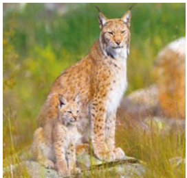
Natura 2000 bietet vielen Tier- und Pflanzenarten wie dem Luchs einzigartigen Lebensraum.

Natura 2000 ist ein europaweites Netzwerk an Schutzgebieten – in Bayern liegen 745 Natura 2000 -Gebiete. Mit der Schüleraktion unterstützt das EU-Projekt LIFE living Natura 2000 im Zeitraum 2019 bis 2022 Schülerinnen und Schüler dabei, Natura 2000 mit seinen einzigartigen Lebensräumen und Tier- und Pflanzenarten zu entdecken.