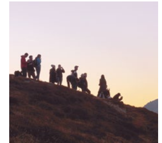
An der Schüleraktion können alle bayerischen Schulen und Schulklassen teilnehmen.

Sie möchten mit Ihrer Schulklasse teilnehmen? Nutzen Sie einfach unser Anmeldeformular unter www.ganz-meine-natur.bayern oder senden Sie eine kurze schriftliche Bewerbung per E-Mail an ganz-meine-natur@anl.bayern.de unter Angabe folgender Punkte: