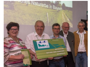
Ausgezeichnetes Engagement: Die Natura 2000 -Gemeinden