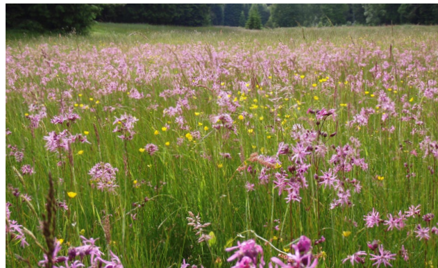
Natura 2000 schützt Naturvielfalt – beispielsweise durch artenreiche Extensivwiesen